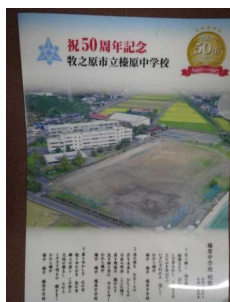
写真入りクリアー ファイル 1200枚