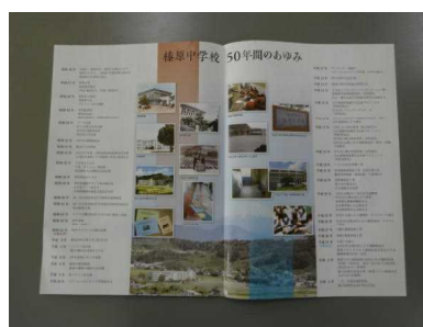
榛原中学校50年間のあゆみ リーフレット 8000枚