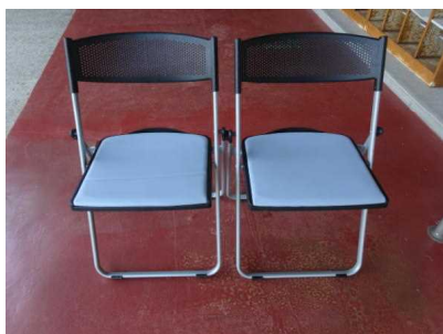
体育館用 折りたたみ椅子 300脚