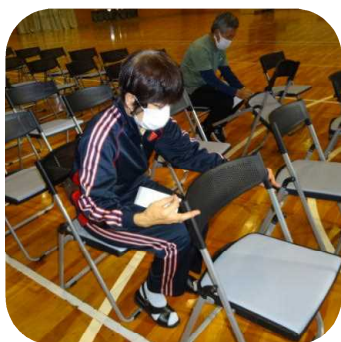
体育館椅子 50周年記念のラベル貼り