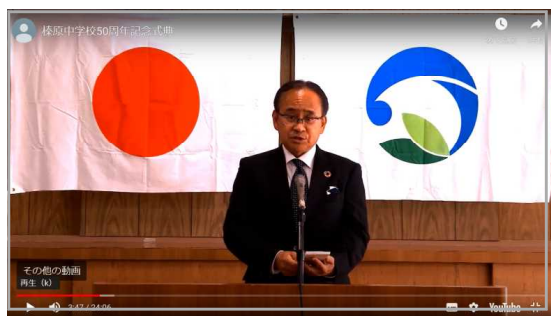
大石友巳校長式辞